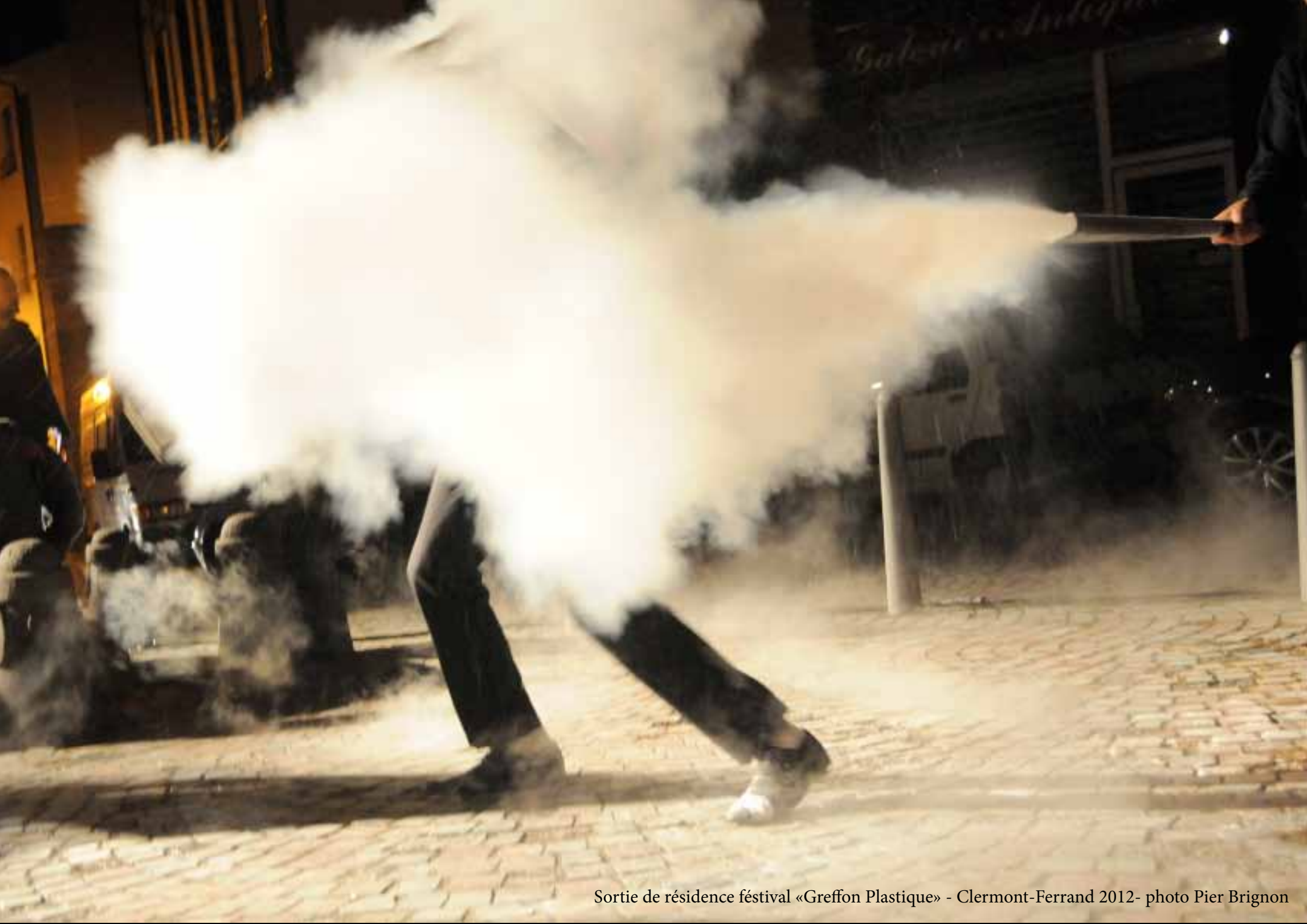
Sortie de résidence festival «Greffon Plastique» - Clermont-Ferrand 2012- photo Pier Brignon